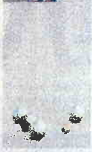
Die Jagd aufs „Schweinchen“: Beim Boule wird der Zielkugel auf die Pelle getückt – hier beim BC Buer im Nordsternpark (im Bild: Gitti Kersten).