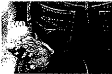
Zwei Kugeln und ein Lappen in der Hinterhand.

Für Anfänger eignen sich am besten ebene, feste Böden für das Boulespiel. Sand ist nicht sehr verteilhaft, da die Kugeln dort nicht rollen können. Außerdem sollten nicht zu viele Hindernisse wie kleine Äste oder Steine im Weg liegen.